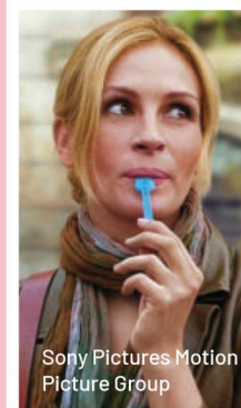
Sony Pictures Motion Picture Group

Giramondo instancabile, alla scoperta delle culture diverse ma anche alla ricerca di qualcosa di più profondo: spirituale, viscerale, sentimentale.